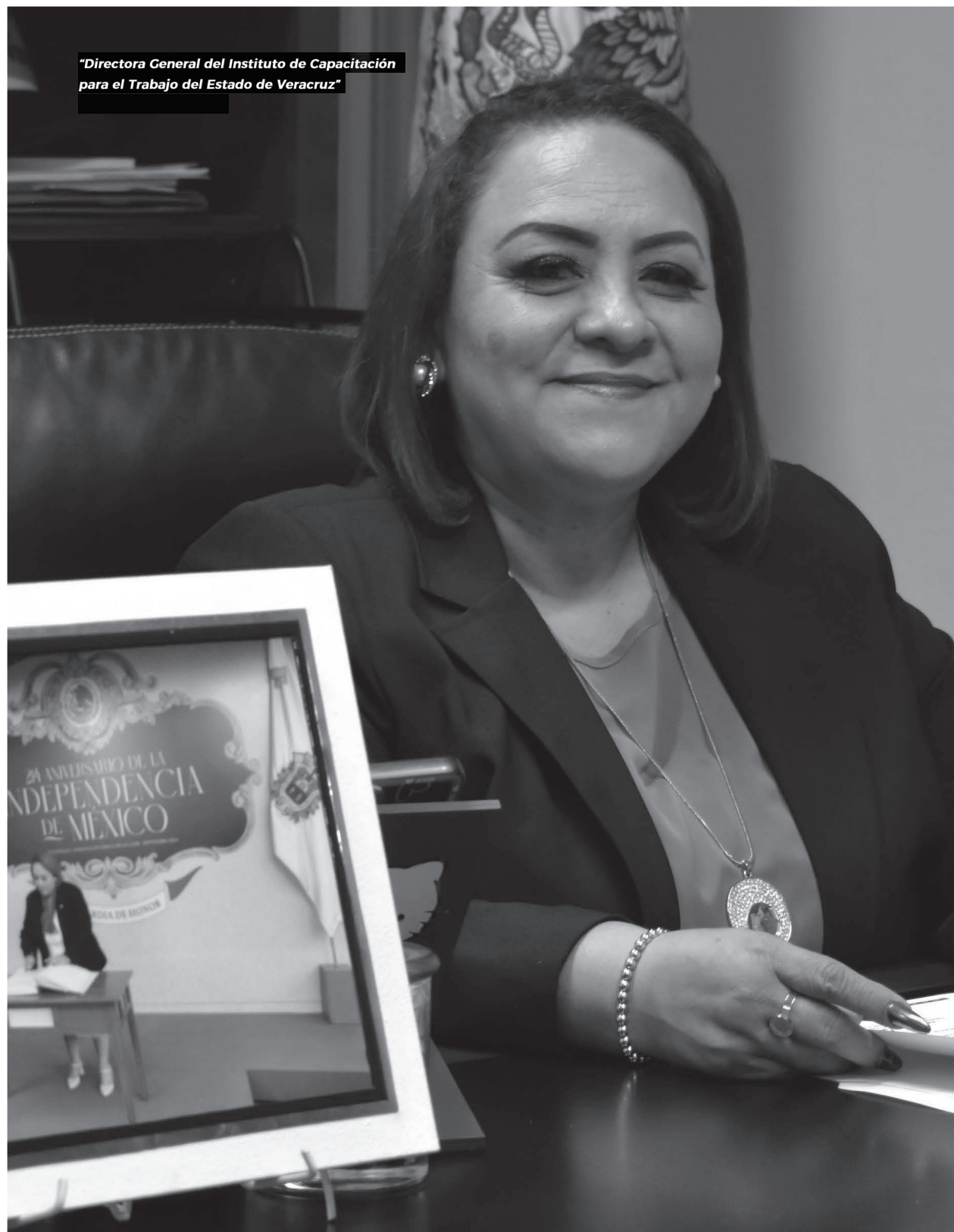
"Directora General del Instituto de Capacitación para el Trabajo del Estado de Veracruz"